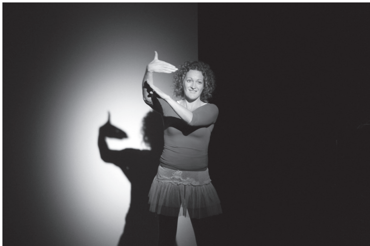
'Why an artist cannot represent a nation-State', (2012)

Sanja Iveković is geboren in 1949 in Zagreb (HRV) en woont en werkt in Zagreb (HRV).