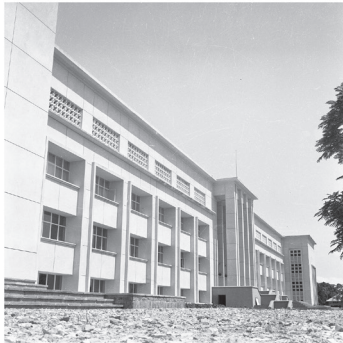
'Le Réduit', (2016)