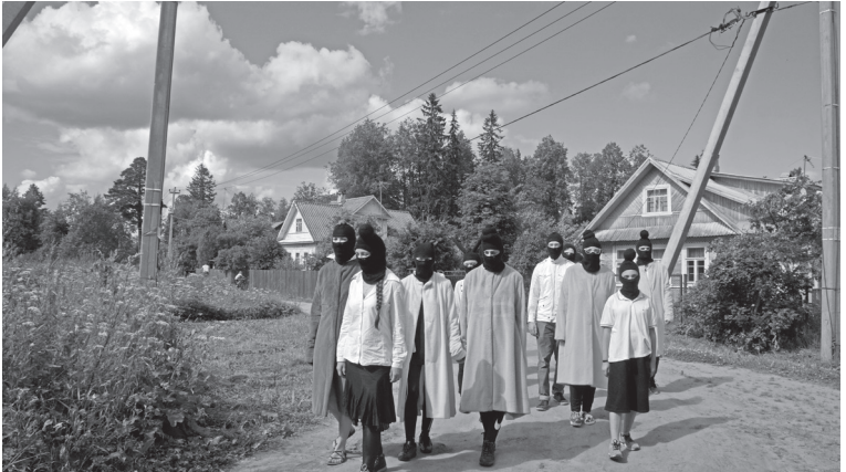
'Slow Orientation in Zapatism', (2017)

PERFORMANCE door Chto Delat tijdens de opening (21.09), om 20:00