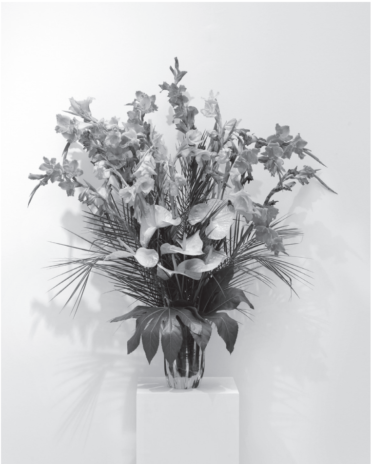
'Flowers for Africa: Ivory Coast', (2015), courtesy de kunstenaar en galerie Jérôme Poggi (Parijs), foto door Aurélien Mole