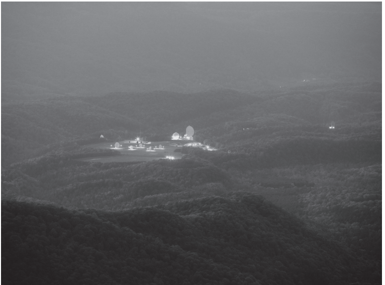
‘They Watch the Moon’, (2010), courtesy de kunstenaar, Metro Pictures New York, Altman Siegel San Francisco

Trevor Paglen is geboren in 1974 in Camp Springs (USA) en woont en werkt in Berlijn (DEU).