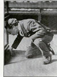
FIG. 17. Object. — English posset cup in the base of a floor case. The observer was asked to read the label.