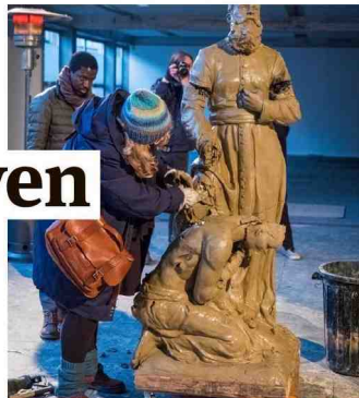
Het publiek in Extra City pakt het beeld aan. De Afrikaan mag het hoofd niet meer buigen. De pater mag niet meer knielen.