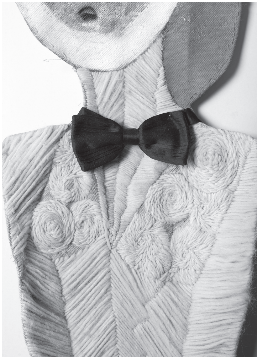
Valérie Mannaerts, 'M.M.', (2019), courtesy de kunstenaar en Bernier/Eliades Gallery