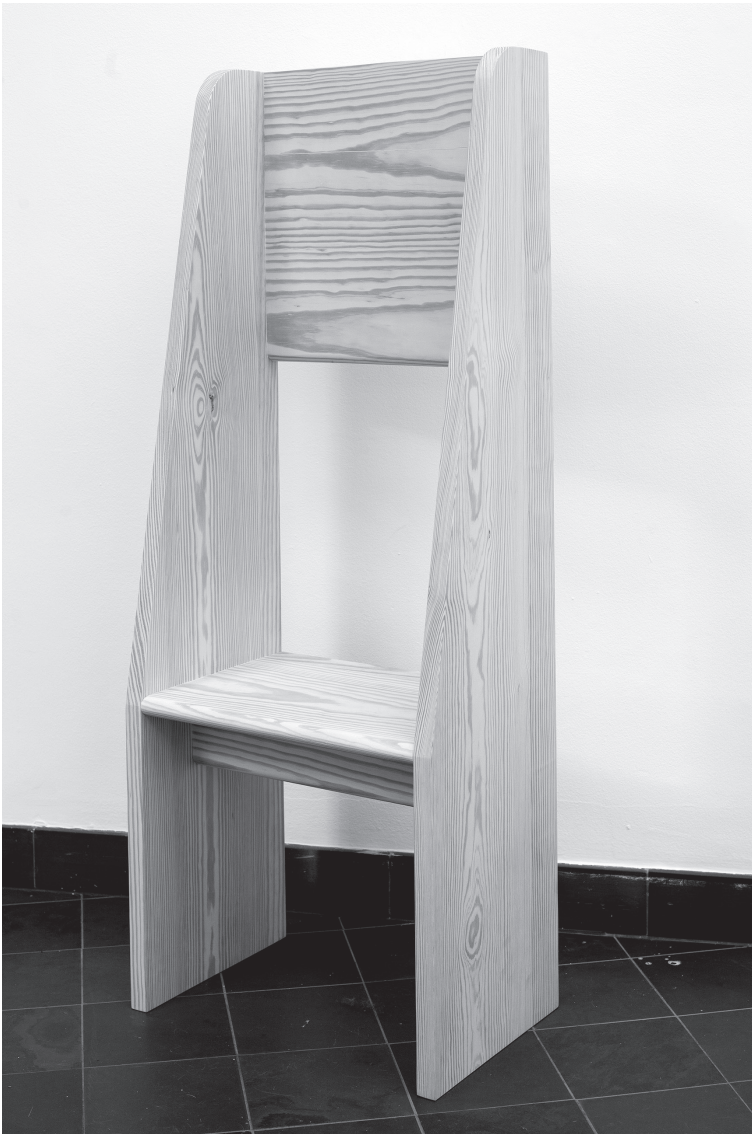
Sophie Nys, 'Manikin', (2019), courtesy de kunstenaar en Galerie Greta Meert, foto door Tom Callemin