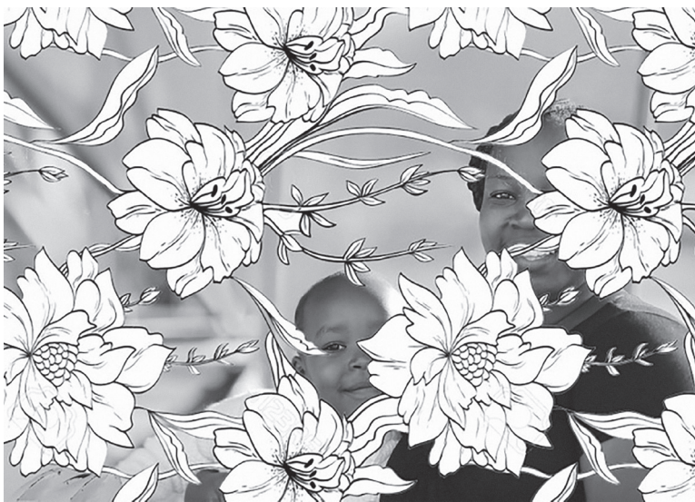
åyr, 'Comfort Zone', (2015), courtesy de kunstenaars